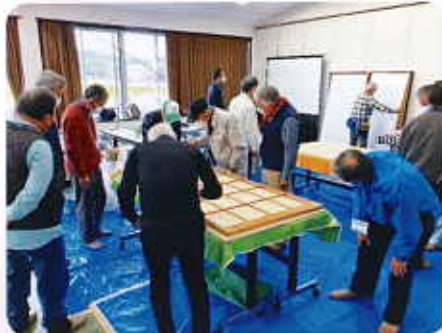
【障子・襖貼り講習】